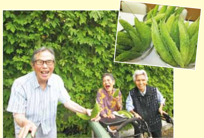
▲たくさん収穫出来て笑顔のご利用者様

今年もグリーンカーテンを設置し、大きく成長したニガウリやゴーヤを100個以上収穫しました。中には30cmを超える大物も育っており、ご利用者様も驚かされていました。ご協力いただいた皆様に感謝申し上げます。