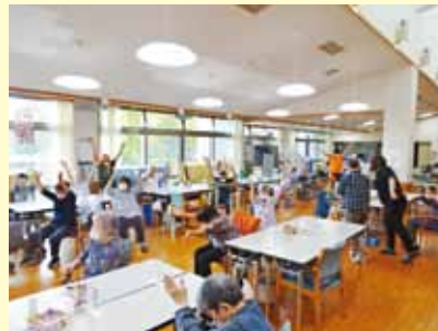
▲ラジオ体操の様子