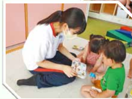
▲福祉体験学習の様子