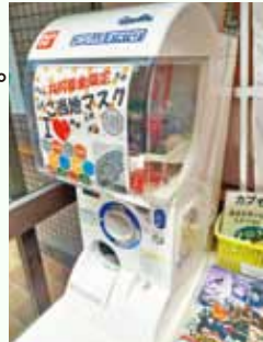
▲きずなの里内設置