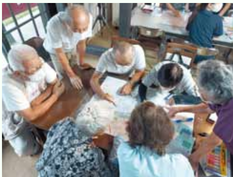
▲8月30日(水) 町4区 (向町・本町・上町・新町)の様子