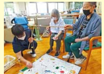
▲季節の行事（夏祭り）