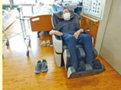
▲最新のマッサージチェア