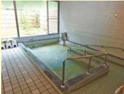
▲きずなの里の温泉施設

当センターの利用希望や見学などについては、担当ケアマネジャーへ相談いただくか、下記問い合わせ先にお電話ください。