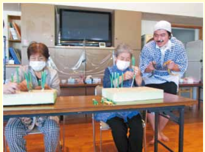
▲田植えのレク：昔取った杵柄！手早く植えてます▼