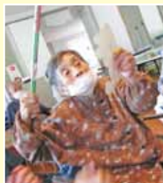
▲魚釣りゲーム：つつい本気になっちゃいます▼