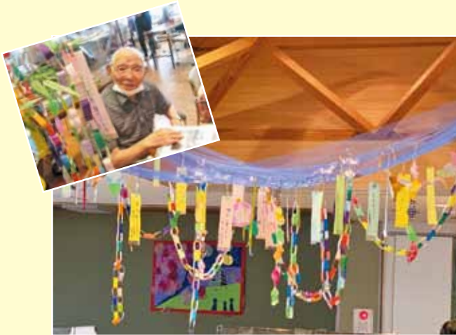
▲願い事が叶いますように☆彡