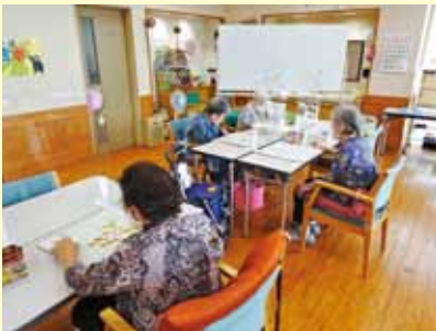
▲脳トレ（文字・数字合わせ）